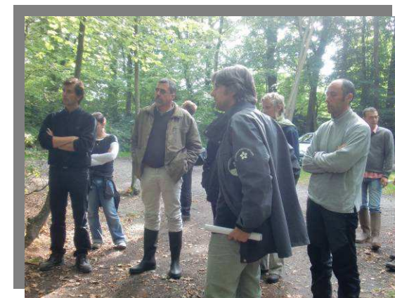
Rencontre des gardes normands - 2010