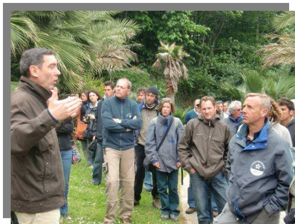
Bretagne - 2011