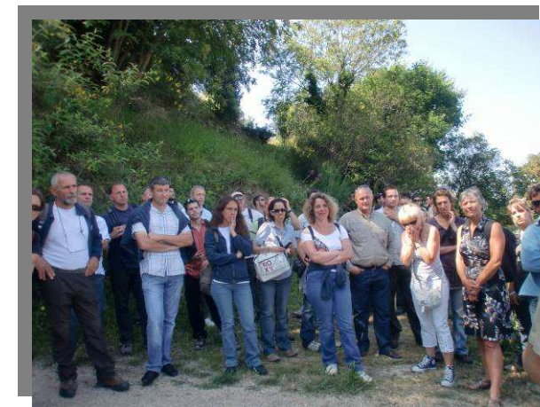
PACA - 2011