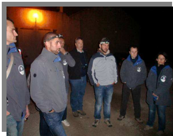
Languedoc Roussillon - 2011